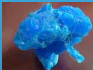
Exemple d'échantillon polycristallin qu'il ne faut pas obtenir