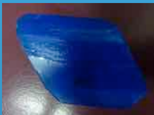
Exemple d'échantillon monocristallin qu'il faut obtenir