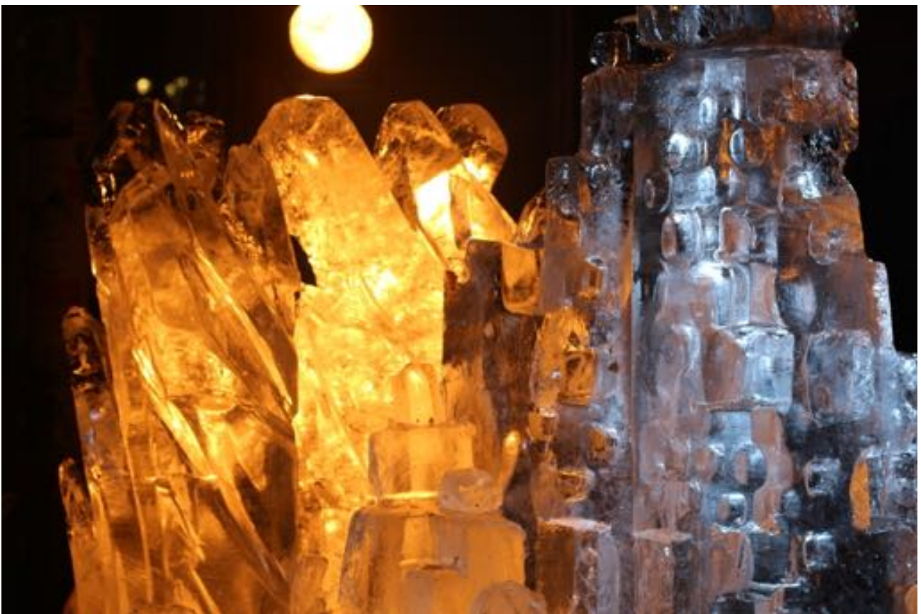
Photo de la journée « Art & cristallographie », sculpture sur glace représentant un cristal de quartz , Marseille 2014